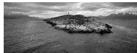
João Musa O canal de Beagle, 2003 El Calafate < Patagônia, Argentina, 20