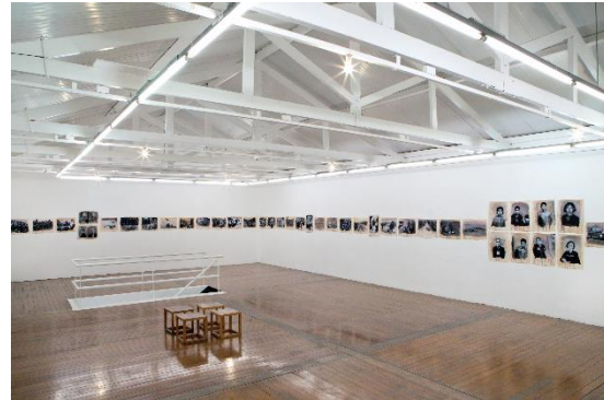
Dora Longo Bahia Desastres da Guerra, 2012